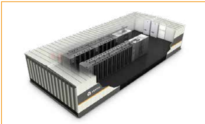
集装箱 / 传统数据中心