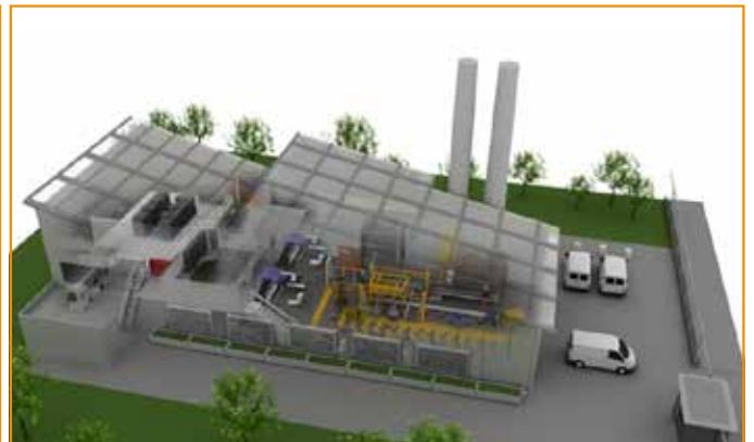
制造 / 工业类